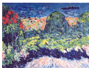
Саттар Бахлулзаде «Новханские дачи» 1965 год