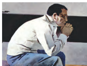
Тайр Салахов «Портрет композитора Г.Гараева» 1960 год

Художник стремится к свободе в своем творчестве, тогда как искусствовед – прежде всего ученый, сотканный из желания систематизировать