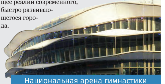
Национальная арена гимнастики

На фоне всего этого признание Баку мировой спортивной столицей – не только заслуженное, но и вполне закономерное событие, отражающее реалии современного, быстро развивающегося города.