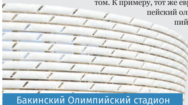
Бакинский Олимпийский стадион

Особо стоит отметить Национальную арену гимнастики, которая несмотря на свое название давно стала многофункциональным спортивным объектом. К примеру, тот же европейский олимпий-