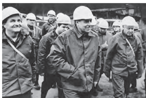
Гейдар Алиев на строительстве БАМа

Общеизвестно, что великий лидер азербайджанского народа Гейдар Алиев сыграл особую роль в истории БАМа. В качестве первого заместителя председателя Совета министров СССР он курировал строительство Байкало-Амурской магистрали. Как отметил Владимир Путин на встрече с ветеранами и работниками железнодорожной отрасли по случаю 50-летнего юбилея Байкало-Амурской магистрали, «Гейдар Алиев сделал все возможное, чтобы