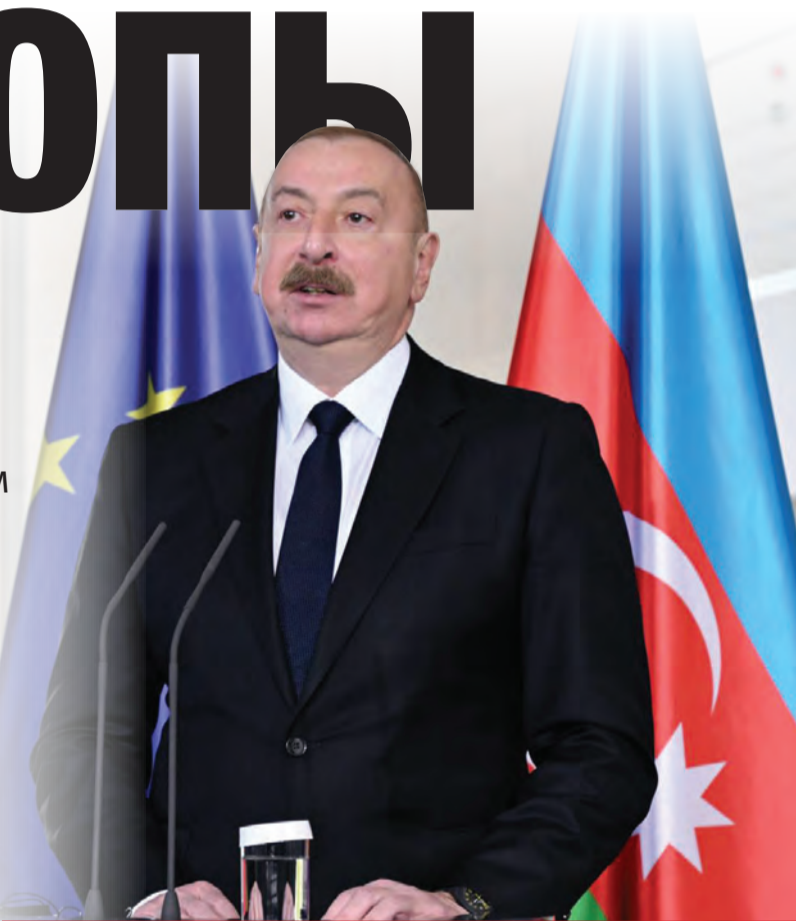
ПРЕЗИДЕНТ АЗЕРБАЙДЖАНА ВЫСТУПИЛ НА МЕЖДУНАРОДНОМ ФОРУМЕ