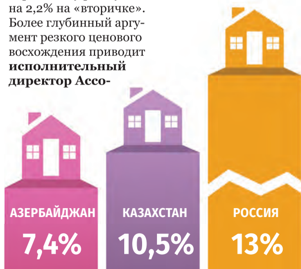
Среднегодовая ставка ипотечных кредитов