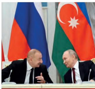
Президенты Ильхам Алиев и Владимир Путин

Президент Азербайджана выразил уверенность, что эта встреча придаст новый импульс развитию отношений между двумя государствами. «В эти дни мы отмечаем 50-летие Байкало-Амурской магистрали. Все хорошо знают, что ваш отец сыграл очень значимую роль в реализации этого проекта», – подчеркнул Президент России Владимир Путин на встрече с Президентом Азербайджана Ильхамом Алиевым один на один. «По сути, он был одним из организаторов этого грандиозного проекта, важного для всего Советского Союза.